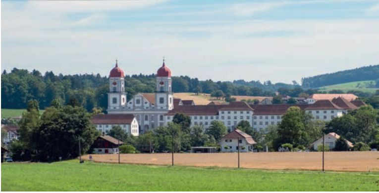
Blick auf das ehemalige Kloster St. Urban: Der Kanton will sich von der Seelsorgeverpflichtung in der Kirchgemeinde loskaufen.